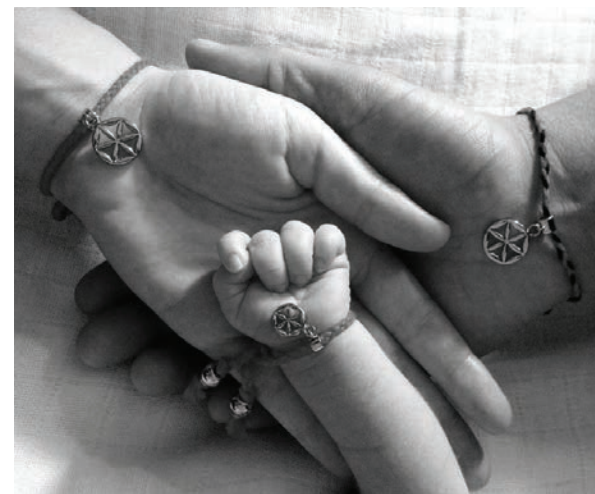
Povera, že červená šnúra ochráni pred urieknutím, je hriechom proti 1. Božiemu prikázaniu

Ako sa máme brániť pred urieknutím? Dôvera v Božie slovo je jedným zo spôsobov. Ďalším je život v čistote srdca, v milosti posväcujúcej, pretože hriech otvára srdce človeka pre pôsobenie zlého ducha. Ďalej sa máme učiť priat ľuďom dobro: „ ...žehnajte tým, ktorí vás preklínajú... “ (Lk 6,27-28) Rodičia by sa mali denne modliť za svoje deti a zverovať ich pod Božiu ochranu. Ich modlitba je na základe auto-